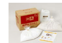
弥生副資材セット (段ボール)

△ 塗厚、下地状況などにより施工面積は変わります。積算についてはお問い合わせください。